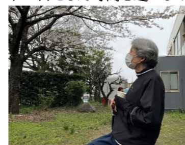
▽2階食堂からも見える桜

△△ドライブ第一弾「おかばる花公園」第二弾「大分市美術館」へ行ってきました。コロナ以前の日常が徐々に戻ってきています。