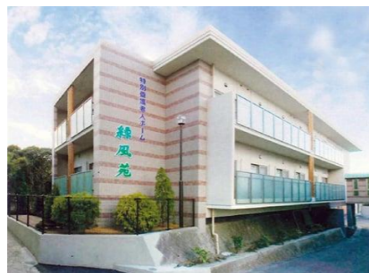
△新館(ユニット型)外観