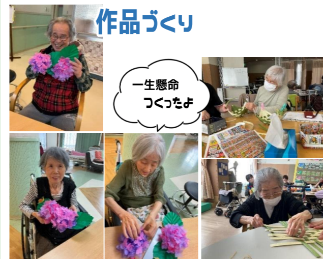
一生懸命 つくったよ