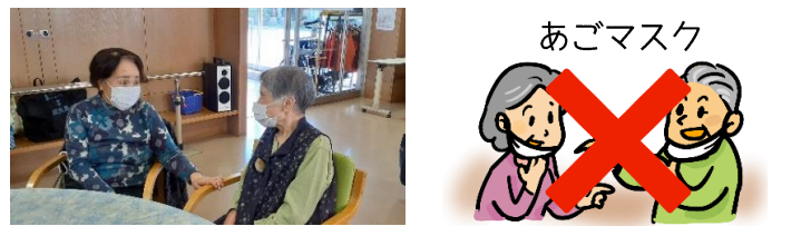
※ マスク着用で感染症対策を行いながら、会話を楽しむ様子