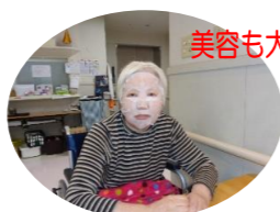
美容も大事でしょ♡